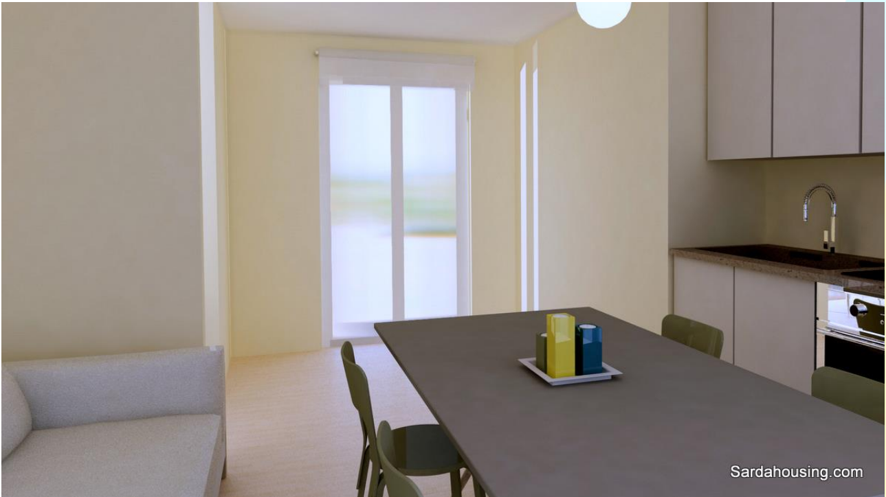
9 - Cala Gonone – Dorgali – Appartamenti Vasco