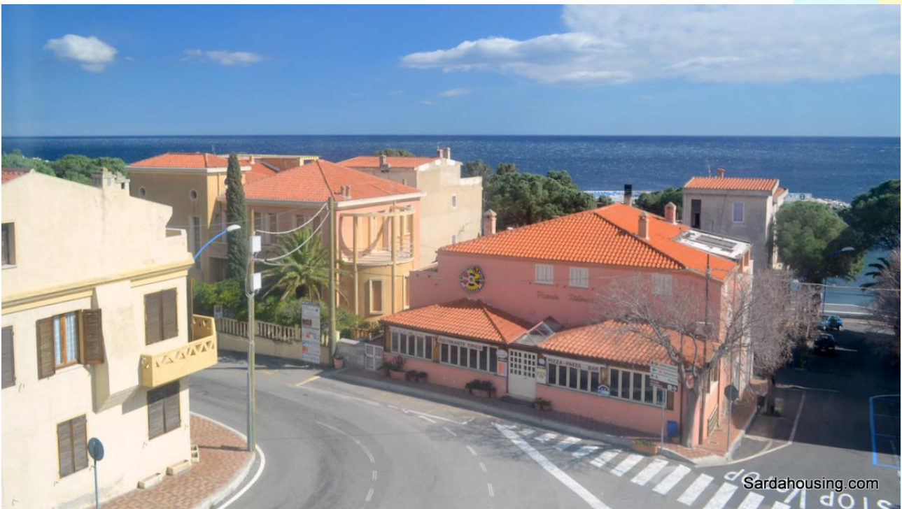
21 - Cala Gonone – Dorgali – Attici Vasco: vista dalla terrazza solarium