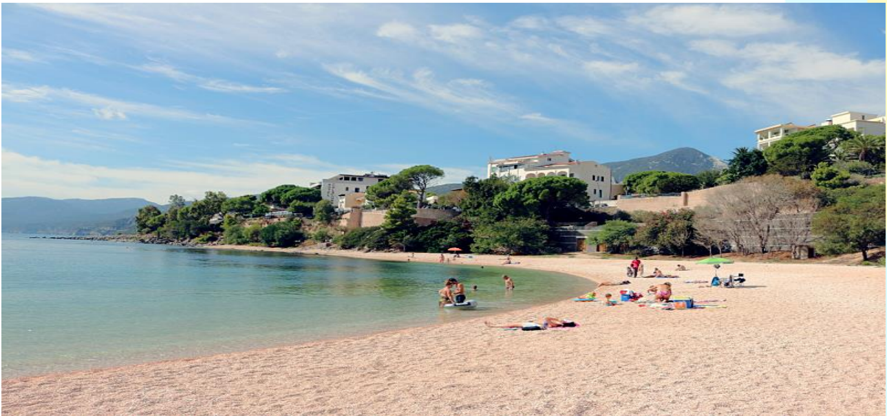
Spiaggia Centrale a Cala Gonone

Distanze: Dorgali 10 km; Nuoro: 39 km; Olbia porto e aeroporto: 107 km.