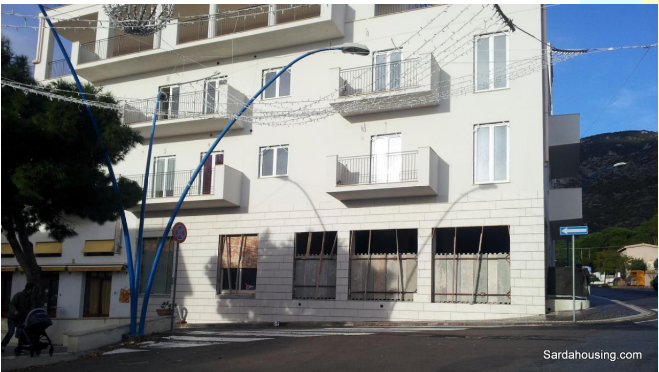
23 - Cala Gonone – Dorgali – Attici Vasco: vista dalla terrazza solarium