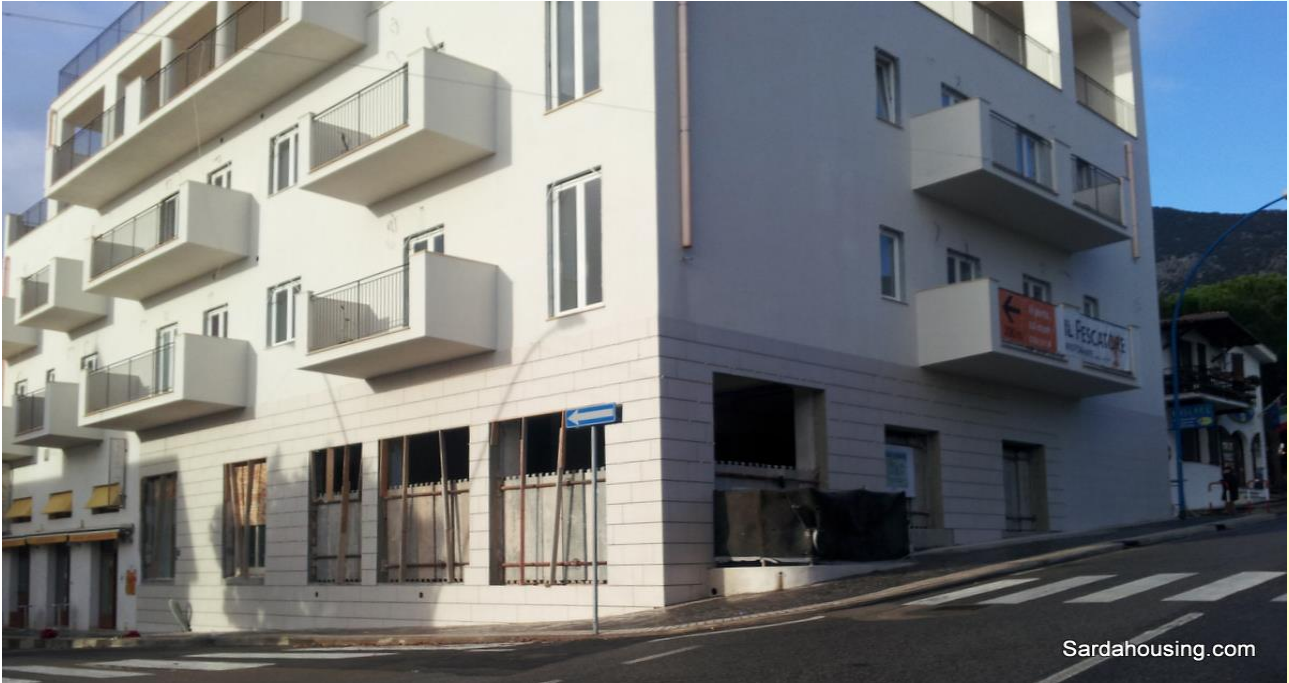
25 - Cala Gonone – Dorgali – Attici Vasco: l'edificio riqualificato