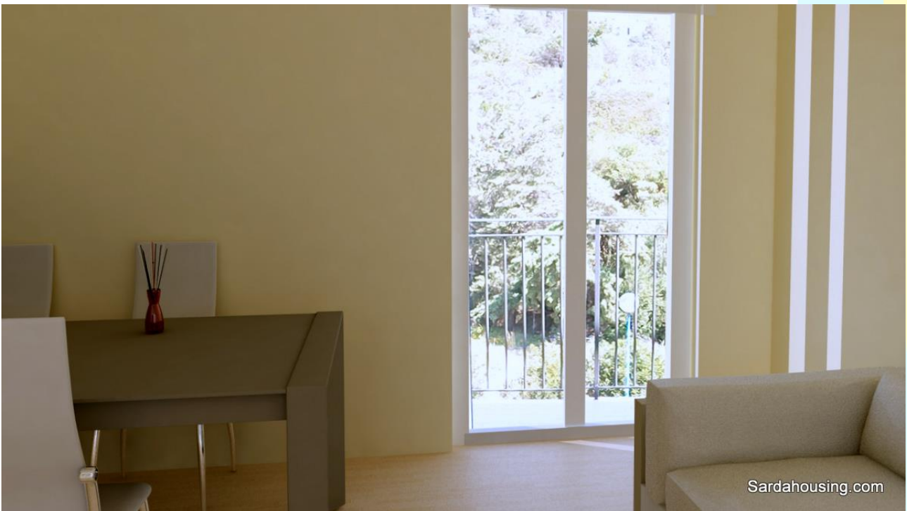
10 - Cala Gonone – Dorgali – Appartamenti Vasco