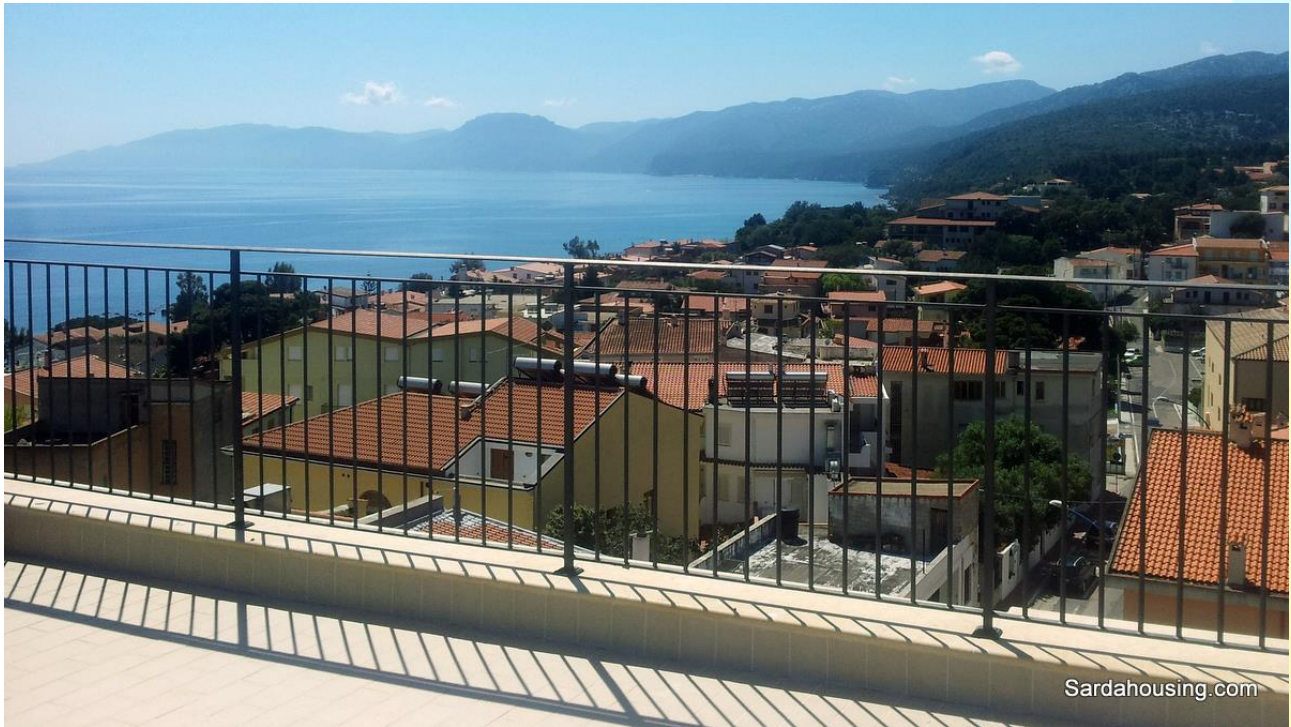
17 - Cala Gonone – Dorgali – Attici Vasco: vista dalla terrazza solarium