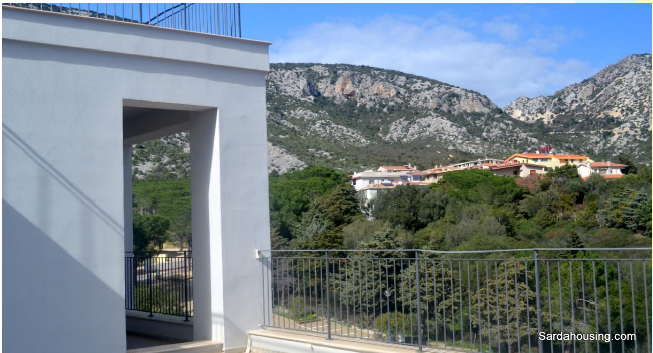
5 - Cala Gonone – Dorgali – Attici Vasco: vista dalla terrazza solarium