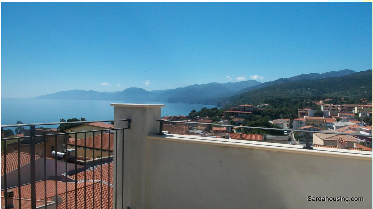
20 - Cala Gonone – Dorgali – Attici Vasco: vista dalla terrazza solarium