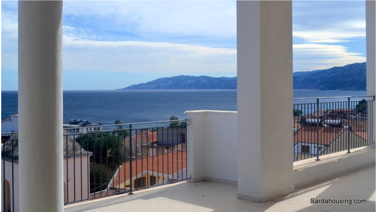
2 – Cala Gonone – Dorgali – Attici Vasco: vista dall'attico