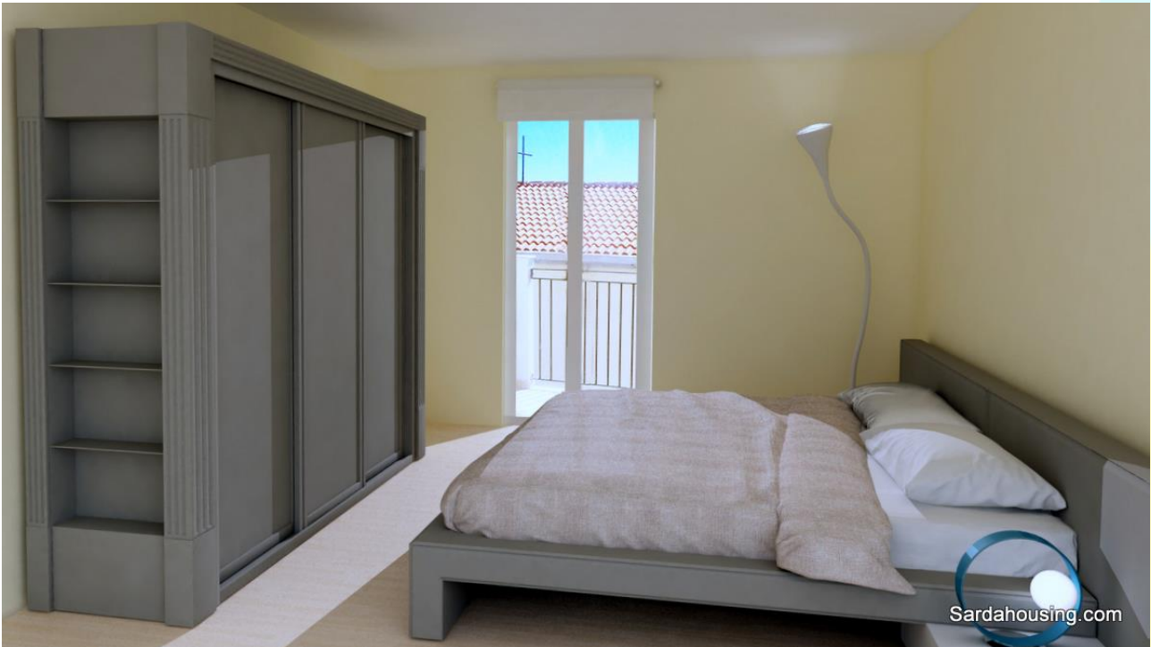
13 - Cala Gonone – Dorgali – Appartamenti Vasco