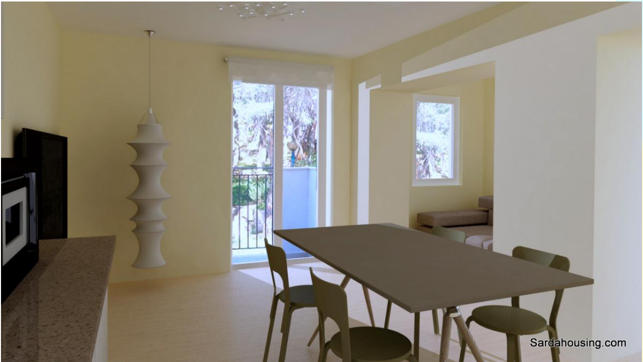
7 - Cala Gonone – Dorgali – Appartamenti Vasco