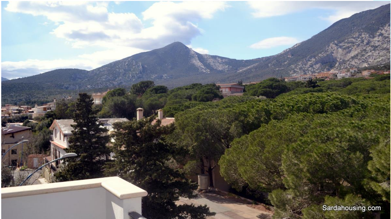
19 - Cala Gonone – Dorgali – Attici Vasco: vista dall'attico