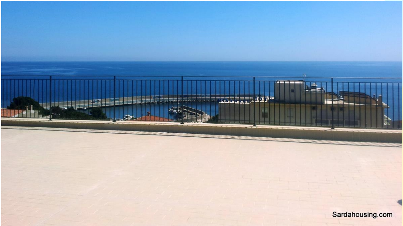
15 - Cala Gonone – Dorgali – Attici Vasco: vista dalla terrazza solarium