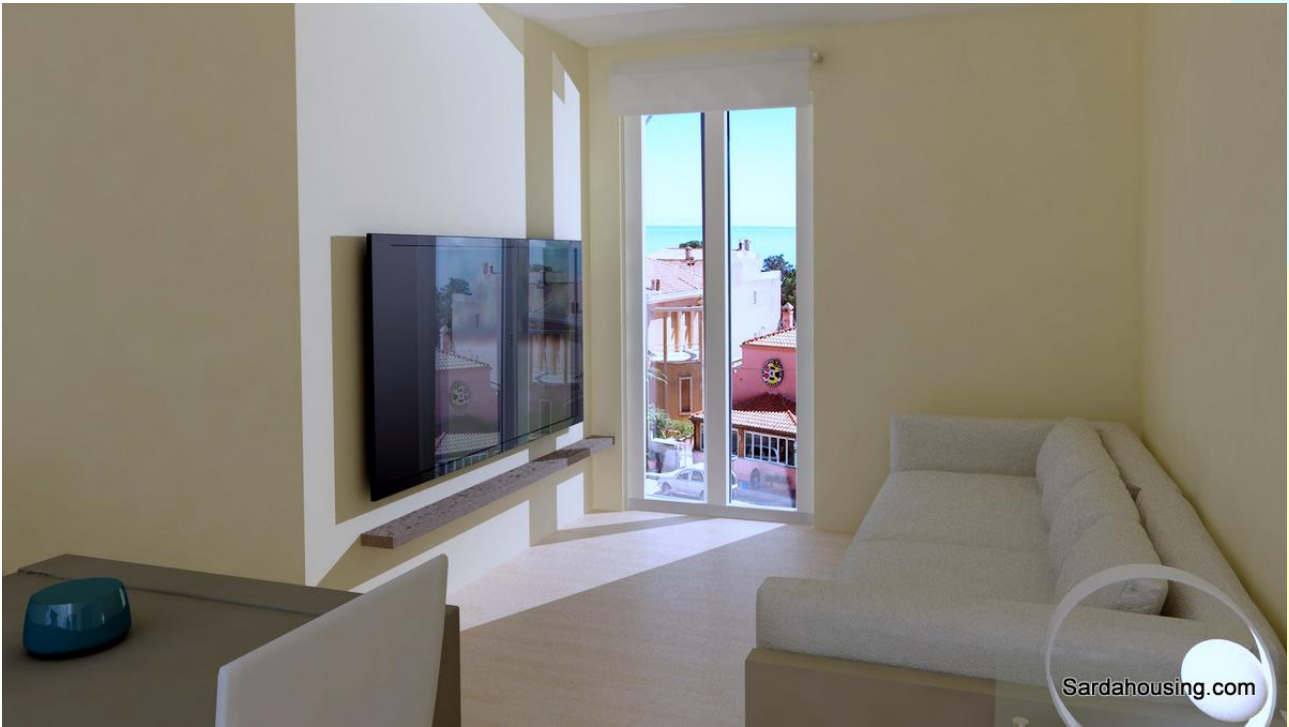
11 - Cala Gonone – Dorgali – Appartamenti Vasco