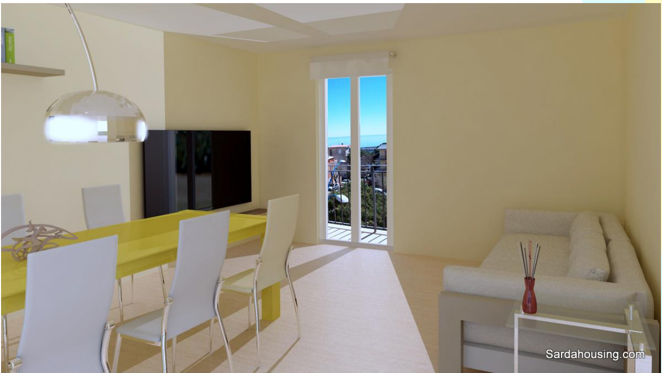
12 - Cala Gonone – Dorgali – Appartamenti Vasco