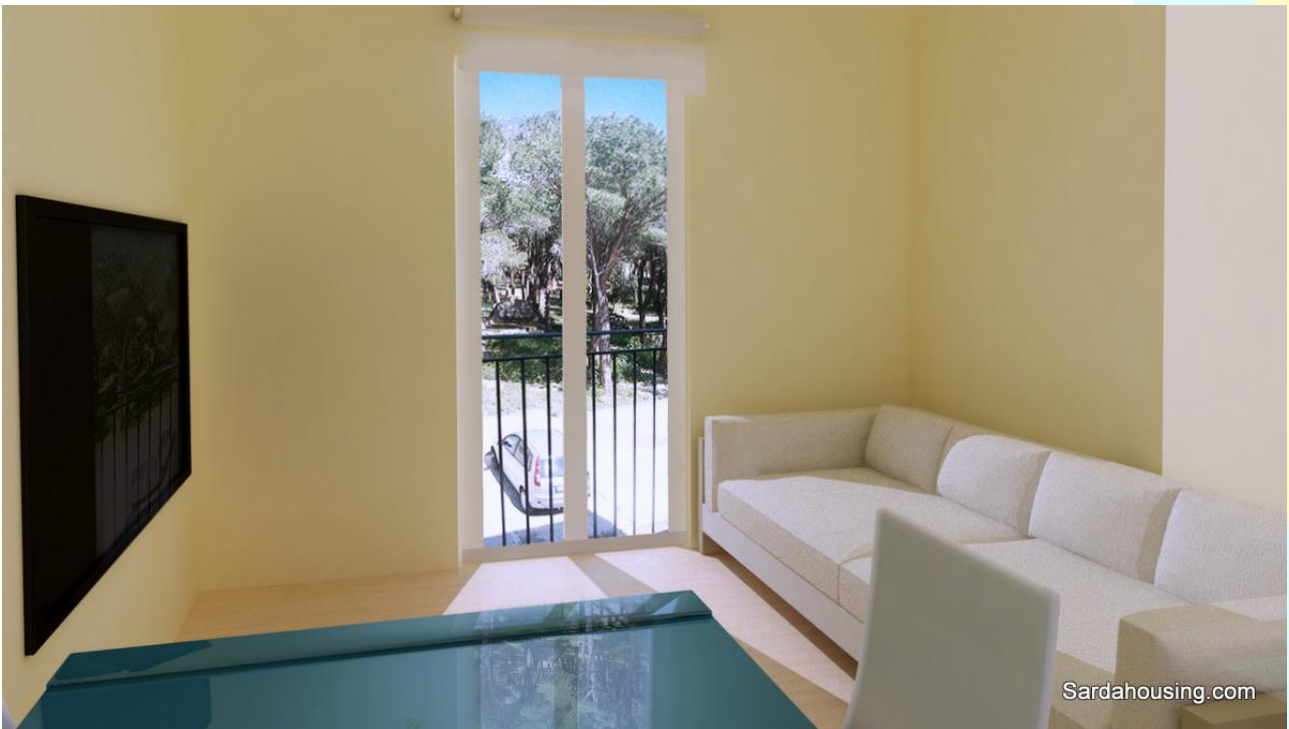
8 - Cala Gonone – Dorgali – Appartamenti Vasco