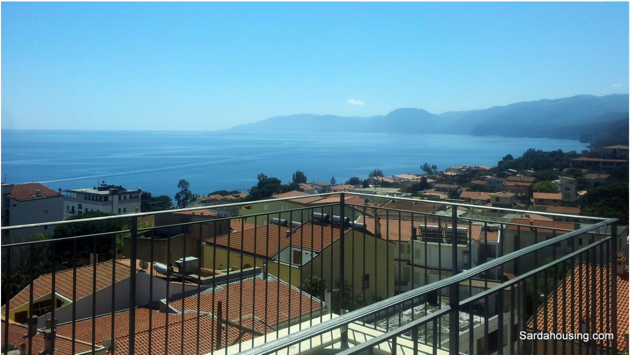
3 - Cala Gonone – Dorgali – Attici Vasco: vista dall'attico