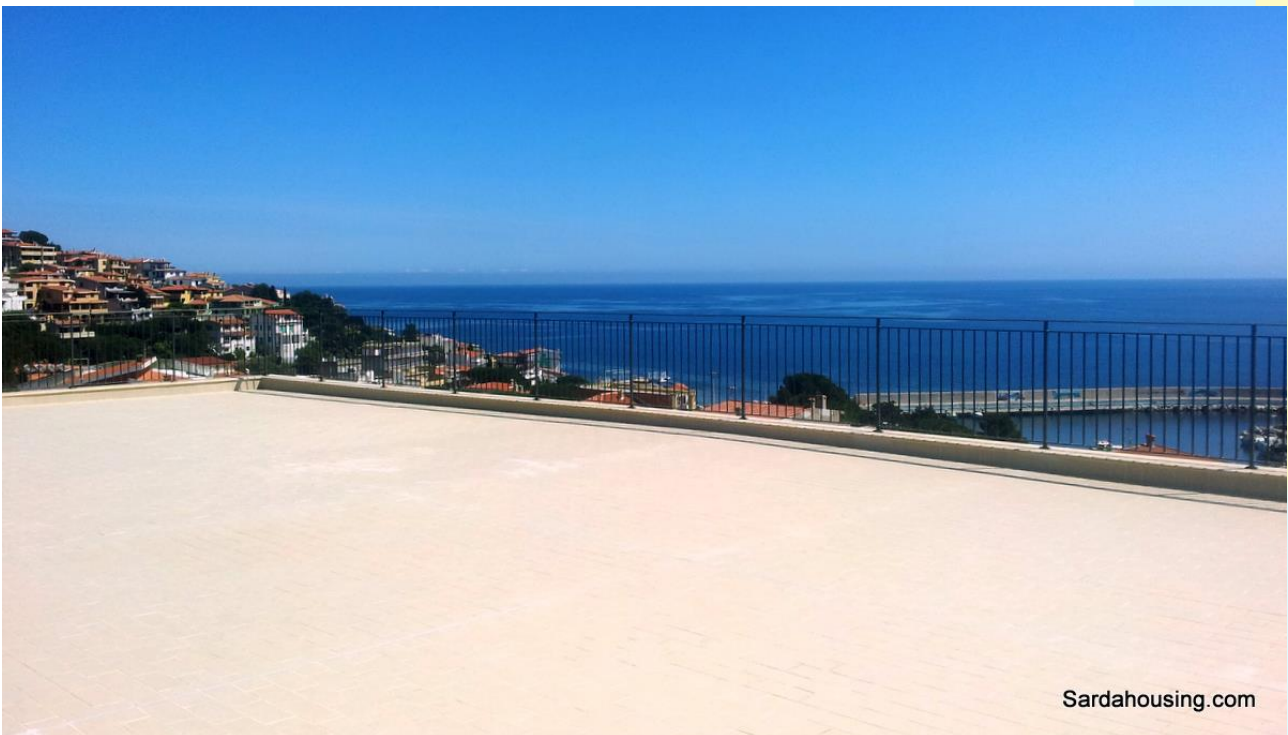
14 - Cala Gonone – Dorgali – Attici Vasco: vista dalla terrazza solarium