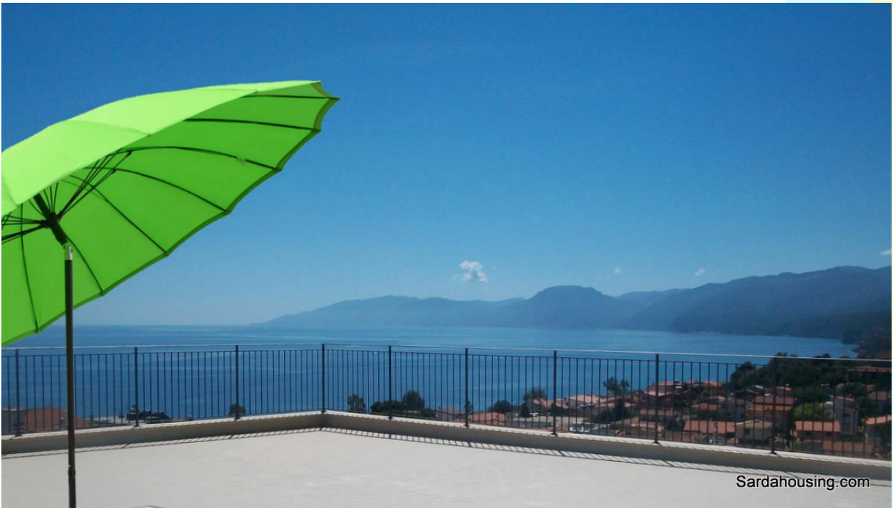
4 - Cala Gonone – Dorgali – Attici Vasco: vista dalla terrazza solarium