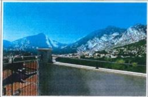
dettaglio superfici / detail surface