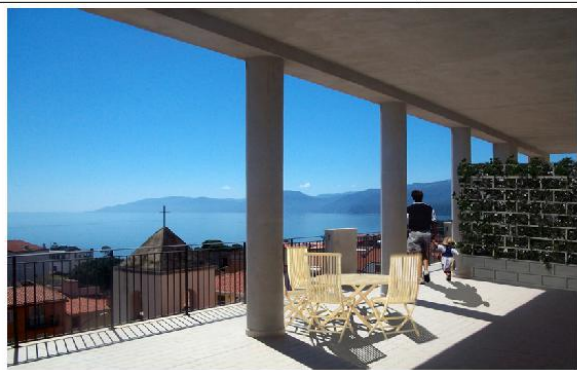
dettaglio superfici / detail surface