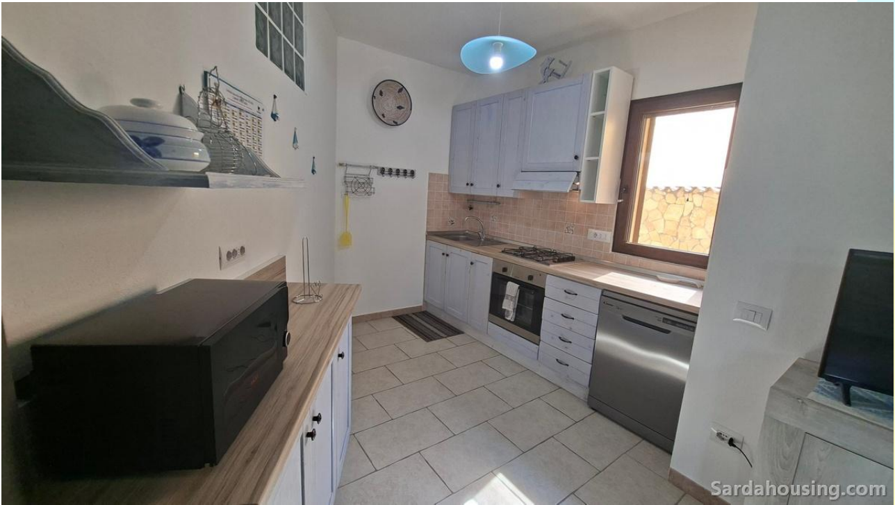
15 - Villetta Alessia a Olia Speciosa – Castiadas: cucina attrezzata