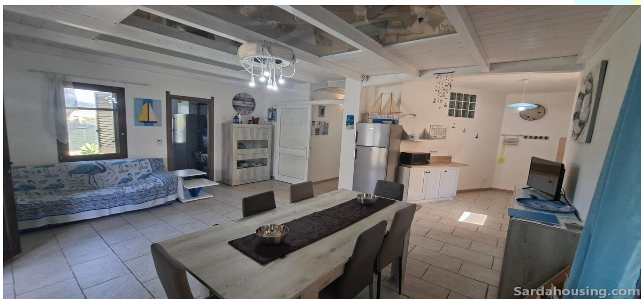
5 - Villetta Alessia a Olia Speciosa – Castiadas: soggiorno