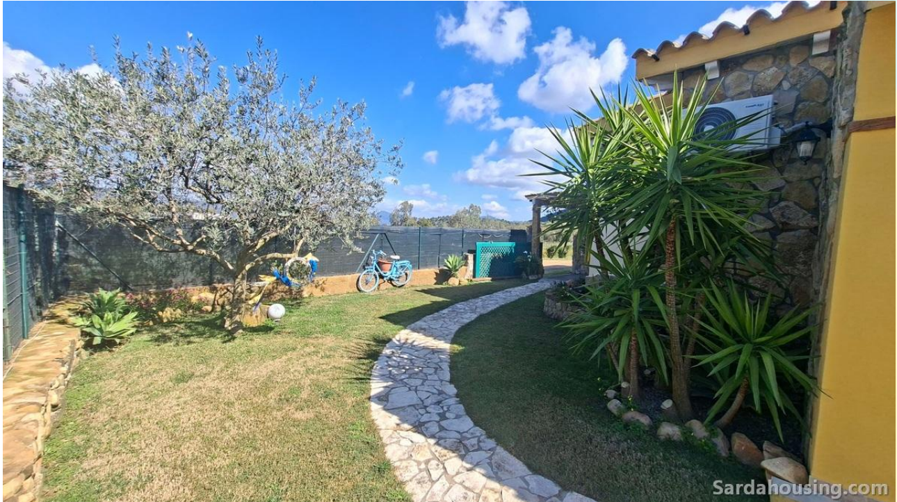
1 – Villetta Alessia a Olia Speciosa – Castiadas: esterni

A Olia Speciosa , a pochi minuti dalle splendide spiagge di Costa Rei in Sardegna , proponiamo in vendita un'incantevole villetta con piscina privata e giardino , immersa nella tranquillità della campagna.