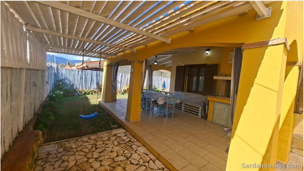
11 - Villetta Alessia a Olia Speciosa – Castiadas: veranda