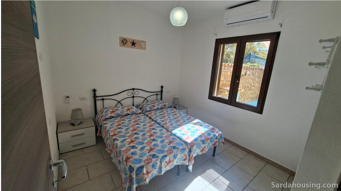
6 - Villetta Alessia a Olia Speciosa – Castiadas: camera piano terra