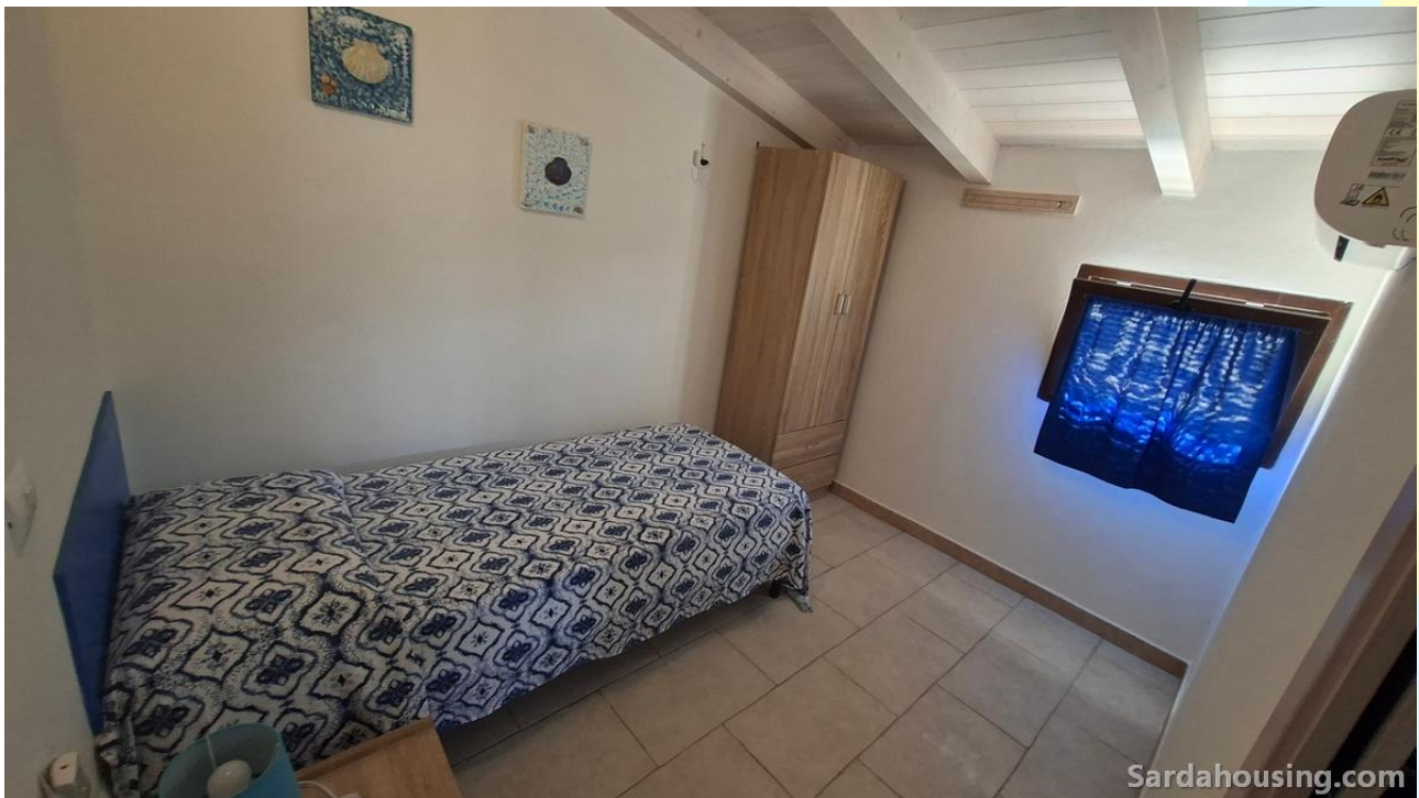
20 - Villetta Alessia a Olia Speciosa – Castiadas: camera piano superiore