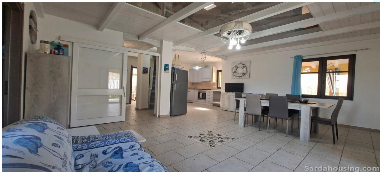
4 - Villetta Alessia a Olia Speciosa – Castiadas: soggiorno