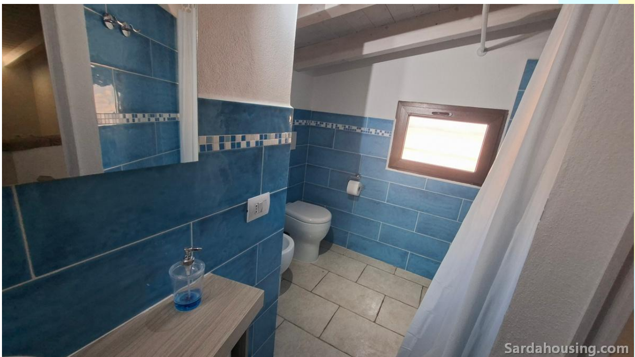
22 - Villetta Alessia a Olia Speciosa – Castiadas: bagno piano superiore