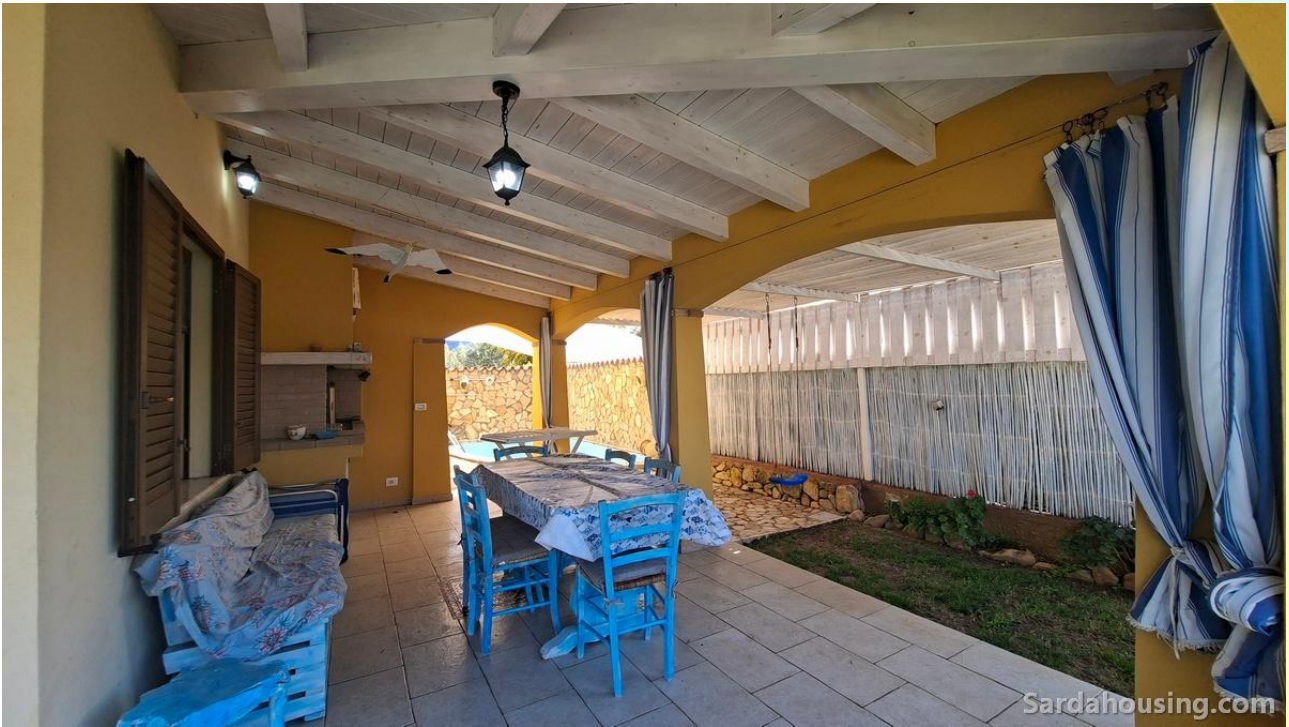
9 - Villetta Alessia a Olia Speciosa – Castiadas: veranda