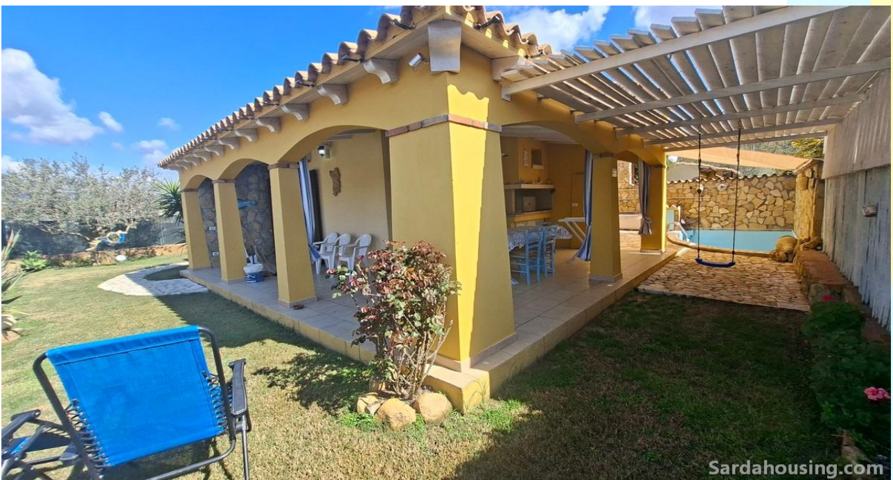
3 – Villetta Alessia a Olia Speciosa – Castiadas: esterni