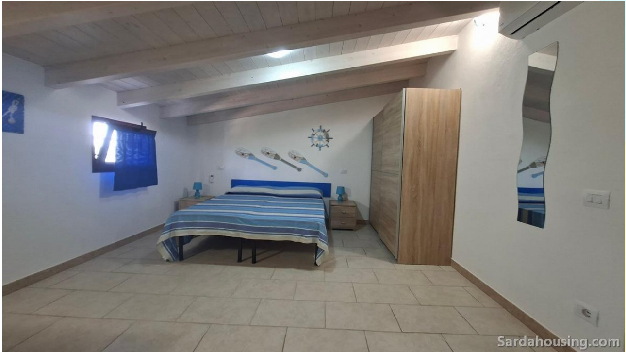
19 - Villetta Alessia a Olia Speciosa – Castiadas: camera piano superiore