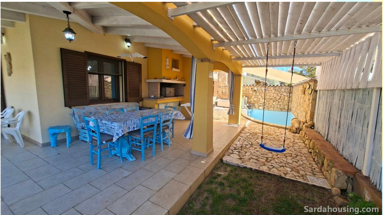
10 - Villetta Alessia a Olia Speciosa – Castiadas: veranda