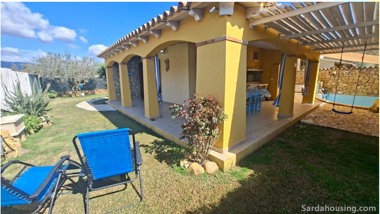
12 - Villetta Alessia a Olia Speciosa – Castiadas: esterni