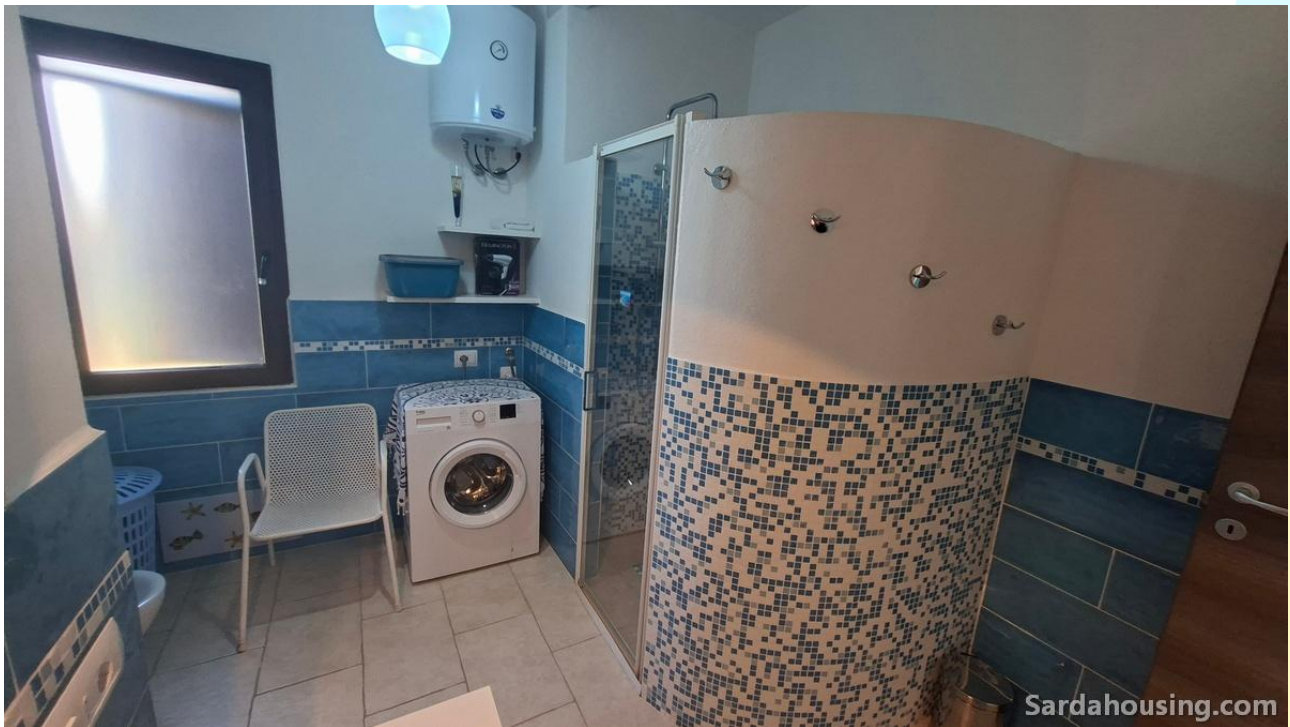
21 - Villetta Alessia a Olia Speciosa – Castiadas: bagno piano terra