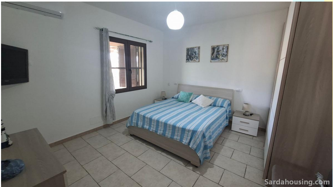
18 - Villetta Alessia a Olia Speciosa – Castiadas: camera piano terra