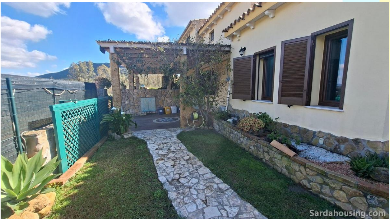
8 - Villetta Alessia a Olia Speciosa – Castiadas: esterni