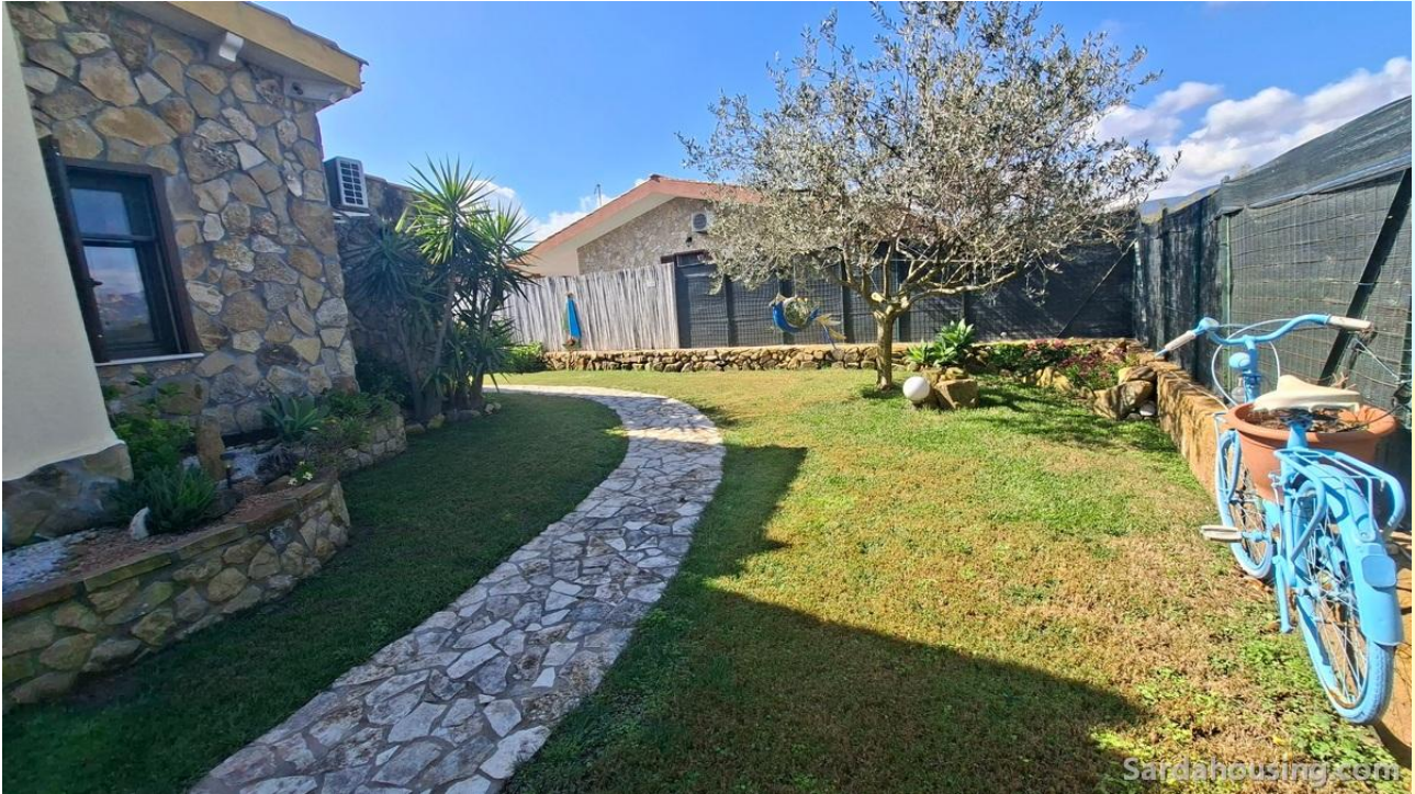
2 - Villetta Alessia a Olia Speciosa – Castiadas: esterni