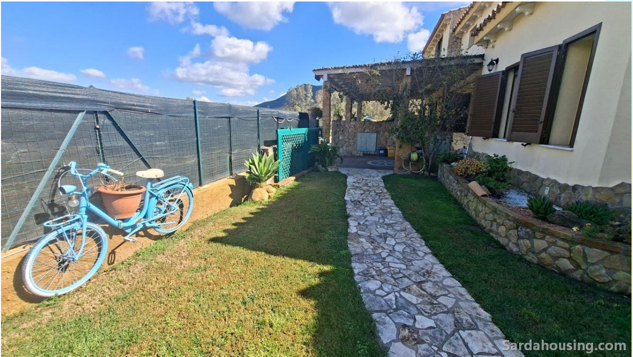
7 - Villetta Alessia a Olia Speciosa – Castiadas: esterni