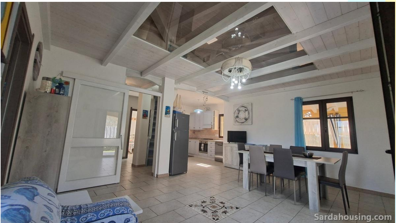
14 - Villetta Alessia a Olia Speciosa – Castiadas: zona giorno